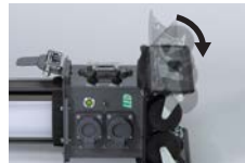
スタンドベース部は折りたたみ式