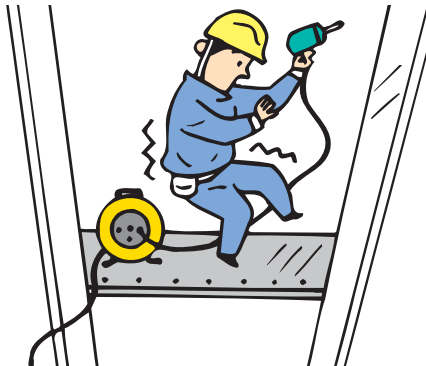
通電性の高い場所