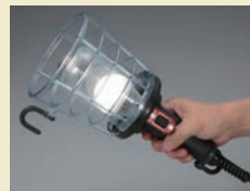
軽量で落としても丈夫な タフボディ