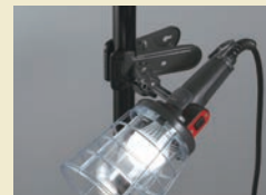
クリップで固定照明にも できます