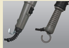
グリップ部フック (CWF-H型/金属製) (CWF-D型/樹脂製)