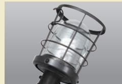
丈夫なフック付ガード