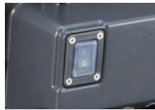
防水カバー付 照明ON/OFFスイッチ