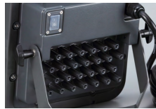
本体背面は丈夫なアルミダイカスト製ボディ