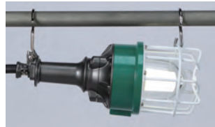
縦吊り・横吊りのできるWフック付