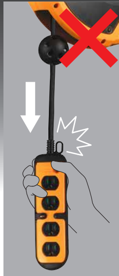
根元に負荷がかかる