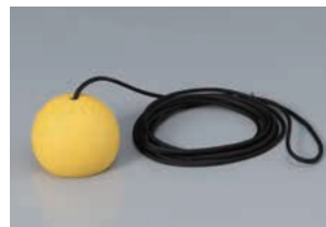
引きヒモ(2m・ボール付)×1 取扱説明書×1