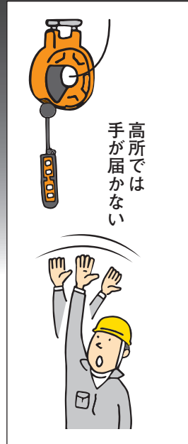
高所では手が届かない