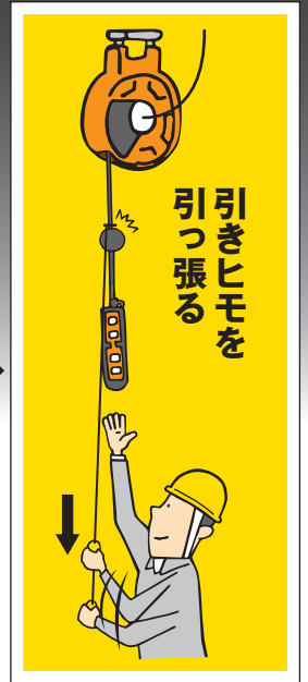
引きヒモを引っ張る