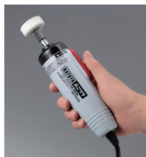
使いやすい コンパクトボディ