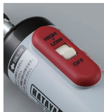
切替スイッチ (HIGH/LOW2段階)