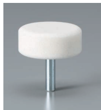
予備砥石1個付 外径φ38 高さ16mm 軸径φ6 軸長22mm